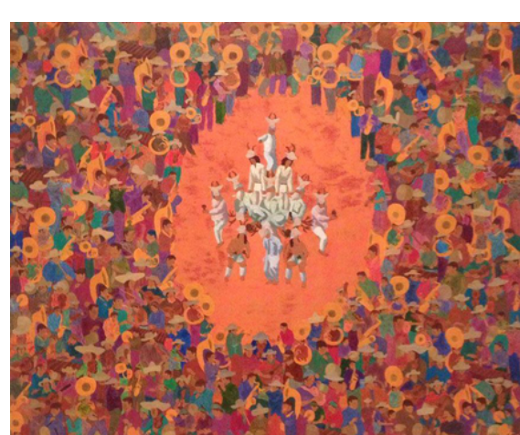
SÁBADO DE GLORIA

OSWALDO VITERI ENSAMBLAJE (162 X 132 CM) 1994