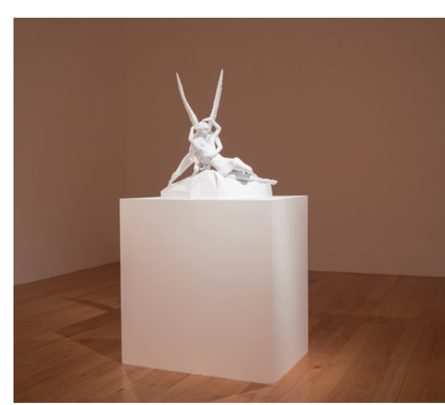
THE WHOLE NETFLIX AND CHILL

DANIEL PÉREZ RÍOS ESCALPURA DIGITAL, IMPRESIÓN 3D PLA. EDICIÓN 1/3 (100 X 100 X 40 CM) 2018