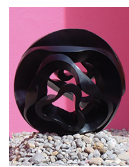
OLAS DE VIENTO

DANIEL PÉREZ RÍOS ESCALPURA DIGITAL, IMPRESIÓN 3D PLA. EDICIÓN 1/3 (100 X 100 X 40 CM) 2018