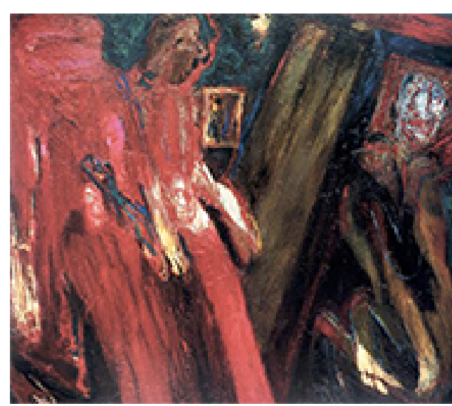
DESCENDIMIENTO CRUZ AMARILLA

ALFREDO CEIBAL ACRÍLICO SOBRE LINO (127 X 102 CM) 1994