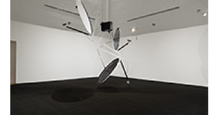
KESSLER I. SERIE KESSLER SYNDROM

ADRIAN PROCEL ACRÍLICO SOBRE TELA (420 X 266 CM) 2009