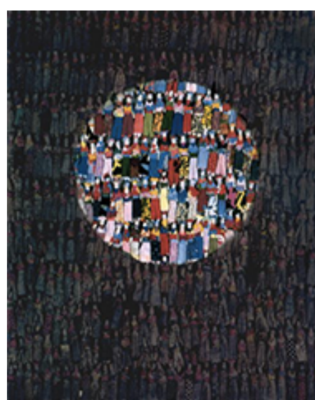
PUNTO DE LUZ, MANTO DE SOMBRA

GILBERTO ACEVES NAVARRO ÓLEO SOBRE TELA (140 X 60 CM) 1994