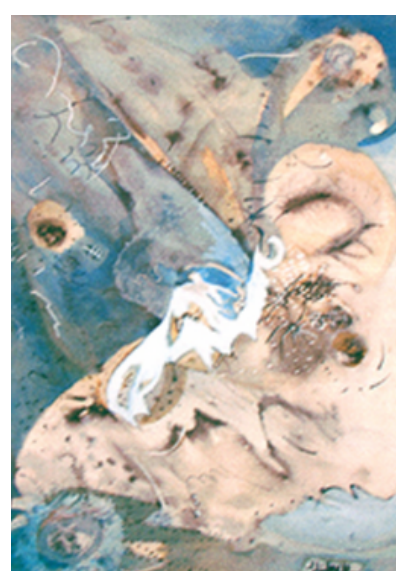
LA OLA MAREA

SHILEY CHERNITSKY BESSUDO GOUACHE SOBRE PAPEL (75 X 60 CM) 1989