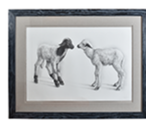
PAREJA DE OVEJAS

RAMIRO MARTÍNEZ PLASENCIA LÁPIZ, TINTA Y ACUARELA SOBRE PAPEL 80 X 103 CM 2009