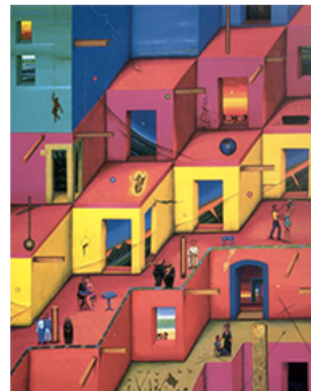
EL ESPEJO PERFECTO

SHILEY CHERNITSKY BESSUDO GOUACHE SOBRE PAPEL (75 X 60 CM) 1989