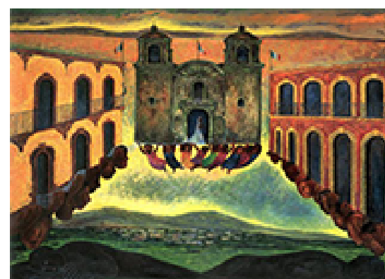
EL VUELO DE LAS NOVIAS

XAVIER ESQUEDA ÓLEO SOBRE TELA (160 X 140 CM) 1994